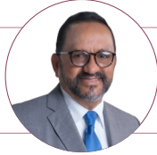
Antoliano Peralta Consultor jurídico del Poder Ejecutivo